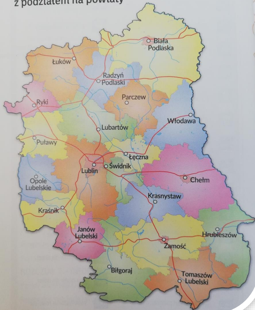
Mapa administracyjna Województwa Lubelskiego z podziałem na powiaty